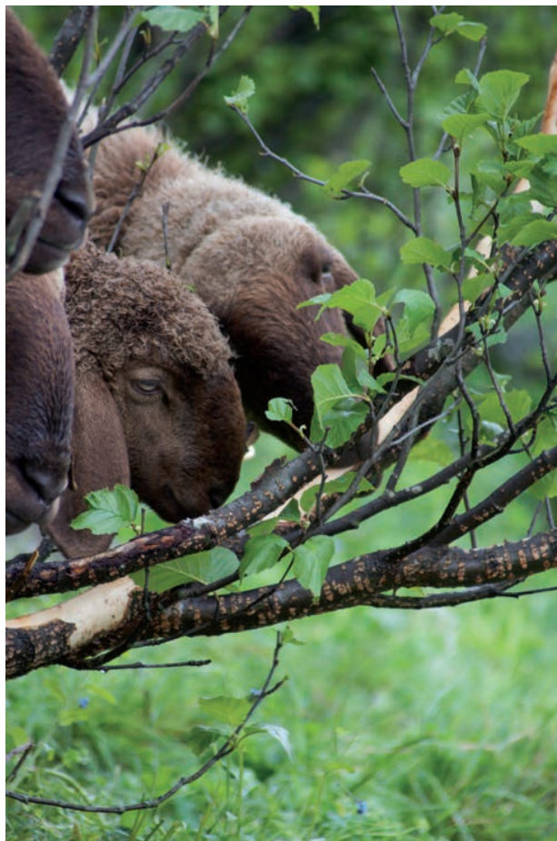
Abb. 3: Engadiner Schafe gehen den Grünerlen an den Kragen bzw. an die Rinde.

Kulturland lässt sich nur durch Nutzung offenhalten. Mechanische Massnahmen (Rückschnitt, Mulchen) sind aufwändig und im steilen Gelände oftmals kaum möglich; sie lösen das Problem nicht dauerhaft. Ziegen und Engadiner Schafe haben hingegen die Eigenschaft, Triebe und Rinde von Sträuchern wie der Grünerle zu fressen, was zu deren Absterben ohne Stockausschlag führt (Abb. 3). Schon nach einer einzigen Weidesaison sind die Erfolge sichtbar. Vor allem Flächen, bei welchen das Einwachsen erst beginnt, können mit einer gezielten Beweidung offen gehalten werden. Andere Schafrassen hingegen fressen nur Gras und keine Rinde von Gehölzen. Ziegen und Engadiner Schafe sollten im Sömmerungsgebiet speziell gefördert werden, da sie sehr gute Dienste leisten im Einsatz gegen die Verbuschung von Grasland und für die Erhaltung der Biodiversität.