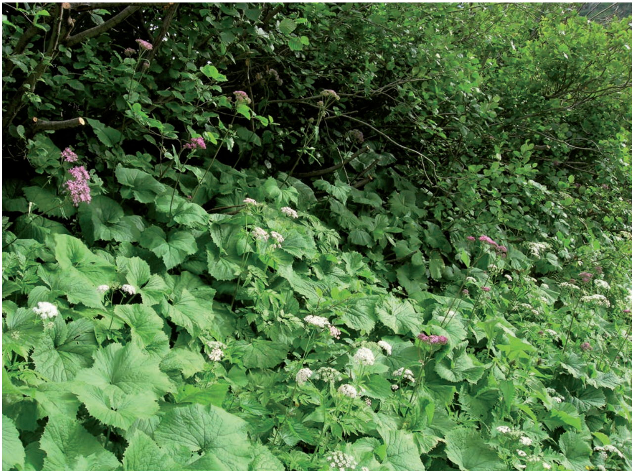
Abb. 2: Der dichte Grünerlen-Unterwuchs lässt kein Licht auf den Boden kommen.

Artikel 104 der Bundesverfassung verpflichtet die Schweiz zur «Erhaltung der natürlichen Lebensgrundlagen und zur